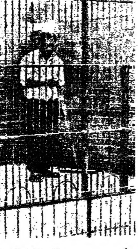
قفص القردة بعد الحادثة

الاطمئنان اولا - ننقل الى حياطة بوليسية ، وقد طلت مرارا تدبير شرطة لفظق الأمن والسلامة وحتى الآن لم اتق الرد على هذا الطلب . ثانيا - طلبت في سنوات سابقة تونر سلا ناري ، بمسحات او ينادق صيد لحراس الحيوانات او تدريب بعض الأشخاص من العاملين في الحياطة على هذه الاسلحة القارية وبمجموعات الحريوات ولم ينفذ هذا الطلب . وبمجموعات حدائق الحيوان في التمام تدريب بعض الحراس من العاملين تهب على استخدام الاسلحة القارية لتقسي اي حياطة يهرب من قفصه لحماية الزوار .. هذا امر واراد وينبغي وضعه في الاعتبار . ثالثا - لا توجد اذاعة داخلية بالحديقة ليدت البيات والزيارات في حالة الاضطراب الى ذلك ، وقد طلبت ايضا في ميزانية السنه المالية الحالية رصد المبالغ الكافية لتدريب وسه الاتصال ، ولم اتق الاجابة . ورفضت ابراهيم الذمير والانسف الشديد فان الصيانة الدورية لآلاته بطلية جدا ، فانا طلبنا صيانة قفص معين االكشف على بعض الابواب ، وتأخر ذلك لسبب شهر او اثنين . على سبيل المثال : فان الباب الخارجي لبعض القفص القرد بحاجة الى تجميل ، طلت لثمة منذ ثلاثة اشهر ولم يتم التفتيش حتى الآن والحريوات ان الجهات المختصة تسرع في صيانة الصيانة على الاتصاف ، ومع ذلك نحن نمر بمرحلة داخل الحديقة للتمكن من صيانة الاتصاف والحريوات . وما حدث لا يدعو الى التراجع فهو قفص قفص ، ويمكن ان يقع في اية حديقة للحريوات في التمام . ونحن مع ذلك لا نلتفت الى تدبير الصيانة وتزويدها بالانعام حتى لا يترك ذلك في المستقبل . واؤكد ان ما حدث او ما فكره من نفس نوع بعض الاكتنايات المطرب تونرها لا يزال اقلنا في داخل قفص مخصص له ، وتزويده تهب تهب الحيوان ونحرص ايضا على توفير السلامة الزوار بوضع شباك من السلك ، بالاضافة الى التفتيش بصافته المسؤولة .